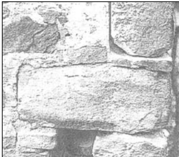
Část gotických ostění oken a portálů použitých při stavbě stodoly

Při pohledu na mapu historického jádra Ivančic s hustou parcelací a drobnou zástavbou nedává mnoho možností pro řešení polohy hradu. Na první pohled však upoutá pozornost nápadně velká, z hlediska městského organismu se vymykající velká area při západním ohybu městského opevnění, severně od dřívější Horní (Oslavanské) brány. Podle mapy stabilního katastru (1825) patřily k této parcele ještě dva drobné pozemky (na mapce č. 7 a 8, dnes domy Palackého č. 17 a 19 včetně zahrad). Jejich situování napovídá, že farní komplex byl ještě rozlehlejší a oba domy byly postaveny na odprodáných pozemcích. Zatímco budova fary (na mapce č. 9) byla při náměstí na jihovýchodě, hospodářské příslušenství bylo na západní polovině areálu. Dominovaly mu velká dvoukřídlá stavení na severu (označené šipkou), na jižní a západní straně jej doplňovaly další objekty, především sýpka při