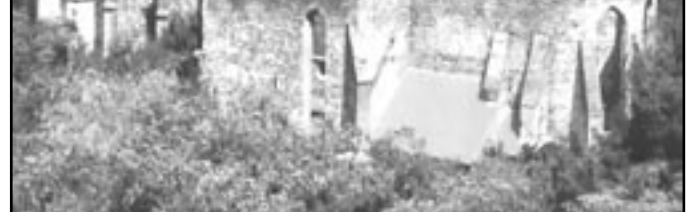
Celkový pohled na zříceninu kláštera

Opuštěného kláštera s celým panstvím se ujaly v roce 1527 Moravské zemské stavy, které jej předaly českému králi Ferdinandu I. Habsburskému. Ferdinand panství nejprve zastavil a nakonec roku 1537 prodal Jiřímu Žabkovi