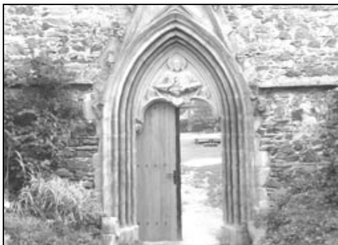
Vstup do kláštera s reliéfem Krista