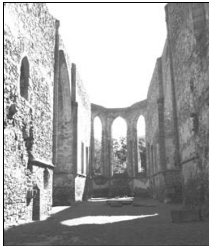
Presbyterium kostela - současný stav

Po nástupu nového probošta Martina Göschla, v roce 1517, nastal velký úpadek kláštera. Probošt