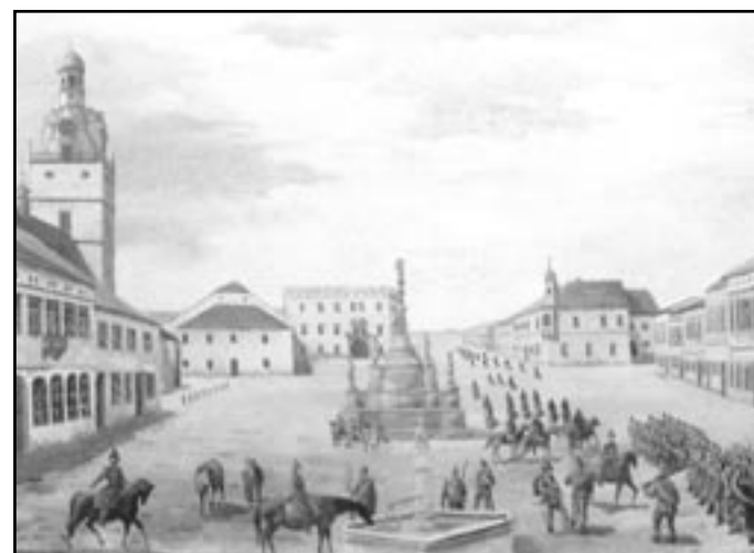
Pruská vojska v Ivančicích v roce 1866. Obrázek od ivančického malíře Hynka Raimanna.

Podle nařízení ivančického okresního soudu bylo město povinno do 19. června zajistit šest povozů „ s dvouma koněma “ pro potřeby armády. „ Očekává se od vlastenecké lásky představenstva “, obracel se na obecní starší „ pan okresní “ Anderle, že „ ono v této záležitosti s největší horlivostí oučinkovat bude, aby se tento rozkaz úplně vyplnil. Když