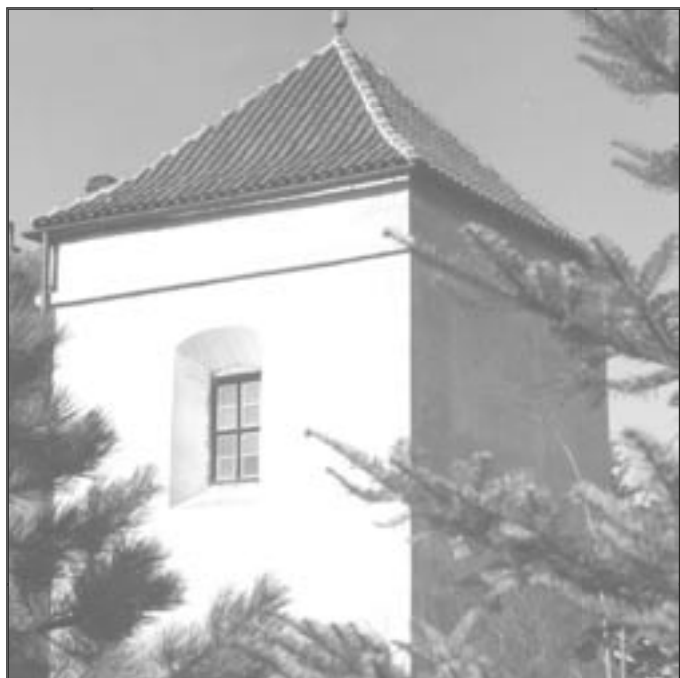
Věž modlitebny v bratrském areálu

Vzpomínkou na České bratry je pro nás i patnáctý obraz Slovanské epopeje, kde malíř Alfons Mucha ztvárnil práci bratří v Ivančicích. Také jedna z polních tratí v katastru města nese dodnes název „Na bratrských“. Jméno Jana Blahoslava má ve svém názvu ivančické gymnázium a stejně tak i jedna z ulic.