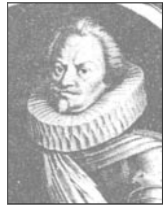
Karel z Lichtenštejna

A co nám v Ivančicích po Československu zbylo? Projdeme-li se ulicí s příznačným názvem Ve Sboru, spatříme pomník Jana Blahoslava, který mu zde byl slavnostně odhalen 21. června 1931. Z bratrských budov se zde dochovala věž modlitebny s částmi zdi, neboť modlitebna v roce 1756 vyhořela. Památkou na působení bratří ve městě je i dům zvaný Nová hospoda na Krumlovské ulici, kde za svého působení v Ivančicích pobýval rektor akademie Esrom Rudinger. Stal se i domovem posledního ivančického biskupa Jiřího Erasta. Na kamenném portálu se dochoval nápis, jehož překlad zní: „Země je