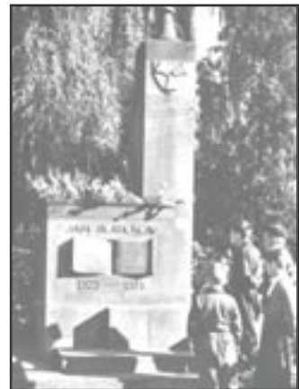
Pomník Jana Blahoslava

Největšího rozkvětu a slávy se dostalo bratrskému sboru ve II. polovině 16. století, zásluhou Jana Blahoslava. V roce 1557 byl pětatřicetiletý Jan Blahoslav povolán do úzké rady a bylo mu vykázáno za sídlo Ivančice. Tento přerovský rodák přišel do Ivančic 12. června 1558 jako nově zvolený biskup Jednoty. Těžiště jednoty se přesouvá z Čech, kde byly pro působení jednoty nepříznivé podmínky, na Mo-