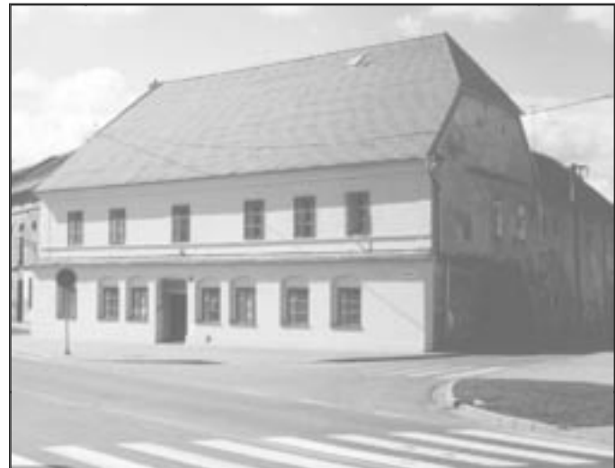
Renesanční dům zvaný „Nová hospoda“

Určitou zajímavostí této školy jsou osudy dvou studentů, Karla st. z Žerotína a Karla z Lichtenštejna, kteří se zde setkali, sprátelili a společně nabývali vědomosti do života. Zatímco Žerotín se ke svému postavení zemského hejtmána pracoval poctivým a zodpovědným jednáním, Lichtenštejn k postupu na výsluní volil cestu plnou bezcharakterního jednání. Jeho nechvalná činnost započala přestupem na katolickou víru. Katolici v té době, ač v menšině, ale podporování Vatikánem, obsazovali svými členy postupně řídicí místa v zemi. Toho si byl Lichtenštejn vědom a jeho náboženský obrat mu otevřel dveře k politické kariéře. Brzy zapomněl na přátelství s Žerotínem na ivančické škole a tvrdě se postavil proti němu. V pravém světle se Lichtenštejn ukázal po potlačení Stavovského povstání. Od císaře Ferdinanda II. dostal plnou moc nad vyšetřováním a potrestáním vzbouřenců. Konfiskací jejich majetků si velmi pomohl. Rozsudky smrti nad 27 českými pány byly spojeny právě s jeho jménem. Tím se stal Lichtenštejn příkladem člověka (dá-li se v tomto případě slovo člověk vůbec použít), který se v touze po majetku neštítl ničeho. A tak se dá říci i na bratrské škole v Ivančicích studoval největší