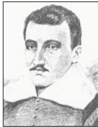
Karel st. z Žerotína

„Já jsem bydlil léta Páně 1570 v měsíci únoru v Ivančicích po osm dní u Jana Blahoslava. Viděl jsem tenkrát v jeho domě na čtyřicet mužů, mladíků a chlapců velmi sečtělých. ... Byli v té čeládce tři kazatelé, kolik bylo jáhnů a pomoc-