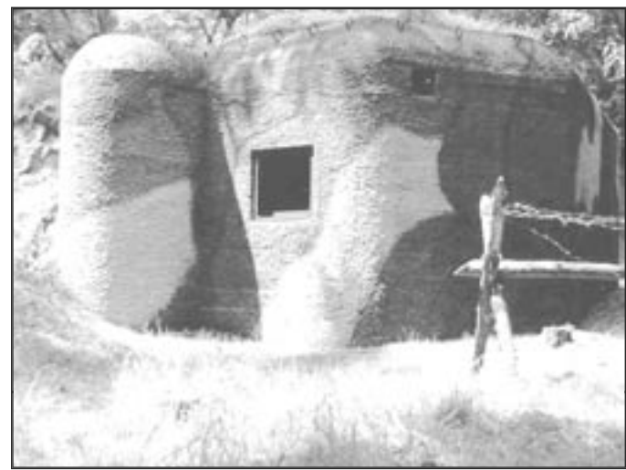
Lehké opevnění vzor 37 typ A-140 (objekt je součástí Minimuzea)

Objekty vzor 37 měly po vybudování v terénu vytvořit palbu hlavních zbraní neproniknutelný pás. Pevnůstky postavené ve dvou - třech sledech se měly vzájemně podporovat a krýt vesměs bočními palbami, doplněnými palbami čelními či kosými většinou ze zadních sledů. Bylo tak vytvořeno souvislé opevněné pásmo. Do opevněného