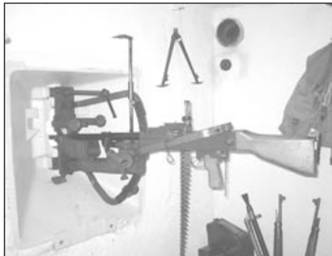
Lehký kulomet vz. 26 (Součást expozice Minimuzea)

Nás nejvíce zajímá úsek č. 16 - Moravský Krumlov. Opevnění tohoto úseku navazovalo na východě u Olbramovic na úsek č. 15 a vedlo přes kótu 338 - Leskoun na západ podél řeky Rokytne až ke kóte 391-