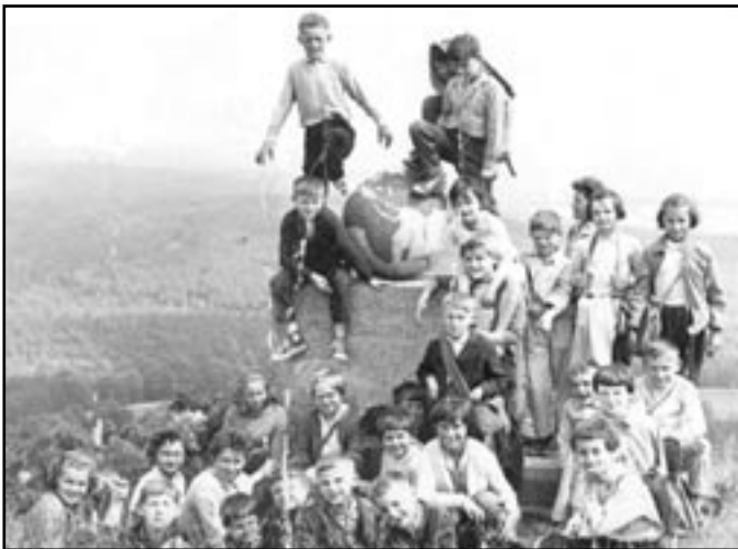
Leskoun býval oblíbeným cílem školních výletů. Žáci petrovické školy u „zeměkoule“ (1964).

Jména význačných přírodních útvarů jako jsou kopce, pohoří, řeky apod. patří k nejstarším. U našeho kopce jsme zaznamenali užívání dvou variant českého jména „Leskoun“ a „Lesoň“, a dvou verzí německého pojmenování „Mistkugel“ a „Mistgabel“. Možností výkladů vzniku českých jmen je více. Původní je snad pojmenování Lesoň – „lesem porostlý kopec“. Jméno blízké vesnice Lesonice bylo snad odvozeno od pojmenování kopce. Německý název „Mistkugel“ = „kupa hnoje“ byl pochopitelný každému, kdo znal původní pohled na Leskoun z roviny úvalu obydlené německy mluvícím obyvatelstvem.