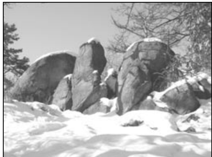
Skupina skal na Vlčí hoře, posledním dochovaném vrcholu Leskounu.

započalo již roku 1918. Zprvu byl rozsah těžby poměrně malý. Až v polovině 50. let 20. století bylo rozhodnuto změnit dosavadní lom na velkolom a bylo naplánováno odtěžení celého kopce. V roce 1966 byl velkolom dobudován a naplno se rozběhla těžba dosahující až 1 mil. tun ročně. Kapacity bylo třeba na nedaleké gigantické stavby dalešické přehrady a dukovanské elektrárny. Památný Leskoun, jeho kulturní a přírodní