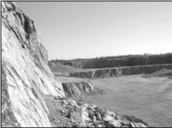
Současný stav kamenolomu na Leskouně.

Památný kopec Leskoun u Olbramovic býval dominantou širokého okolí. Byl cílem školních i rodinných výletů. V pravěku i v době nedávné býval „posvátnou horou“ - středem krajiny. Pro archeology i přírodovědce býval horou hojnosti. Za poslední půlstoletí zmizel, v krajině zůstala hluboká jizva. Vydejme se společně pátrat po stopách zmizelé památky.