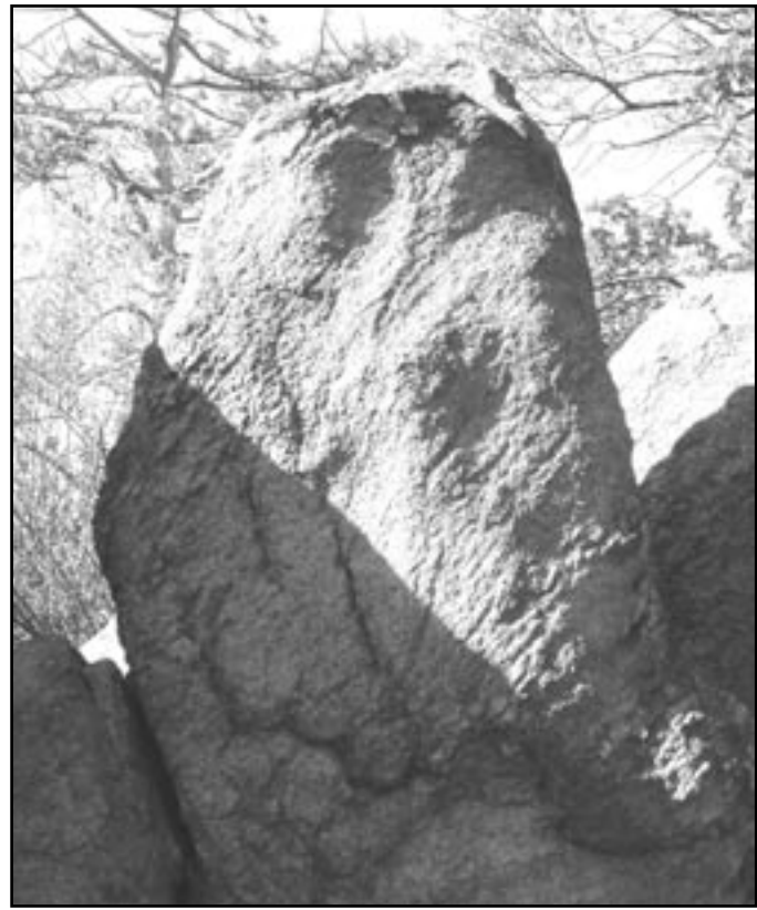
Tajemná skála na Vlčí hoře připomíná lidskou tvář.