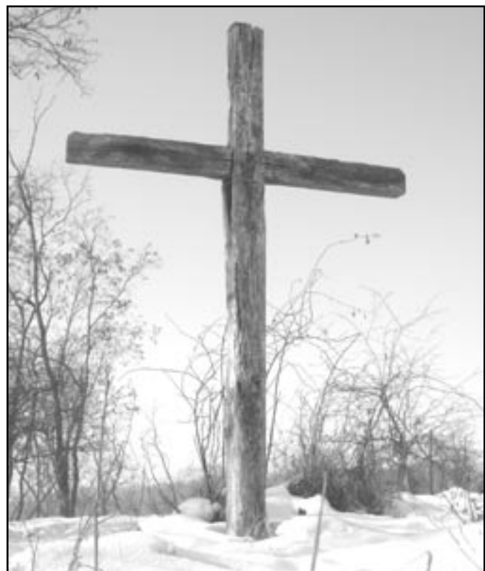
Dřevěný kříž, který původně stál na vrcholu Leskounu.

nu postavil za 1. republiky železničář Brínek ze strážního domku pod kopcem betonový podstavec s červeno-modro-bílým obrysem Československa a nápisem. Na něm umístil model zeměkoule s vyznačenými světadily. Materiál si sám ve kbelcích a v batohu vynášel nahoru. Někdy marně, protože olbramovičtí Němci mu materiál rozhazovali a vodu vyvalovali. Po Mnichovu stejně zničili obrys ČSR a český nápis. Země-