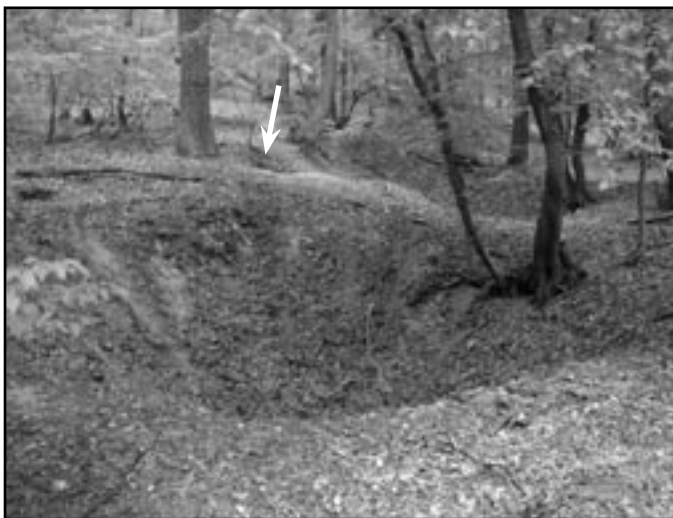
„Skryše“ v lesnickém Hájku. Šipka označuje ústí dokumentované jámy.

vzápětí prohloubil odstraněním závalu. Obilnice má naprosto shodné rozměry s předešlou (1,9 x 3 m). Kolem hliníku je několik propadlin po dalších objektech. Podle vyprávění pamětníků se zde asi před 30 lety při práci v lese propadl kůň, zřejmě do po-