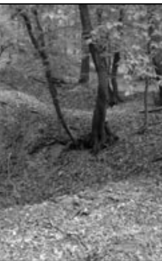
Členové expedice na dně jámy. Obilnice se mohly stát dočasným úkrytem obyvatel vesnice. V této jámě se mohlo „pohodlně“ skrýt asi osm lidí.

i dlouhodobému uskladnění obilí. Dobře ošetřené obilnice dokázaly konzervovat obilí po více sezón, výjimečně i desítky let. Dlouhodobé zásoby byly důležité k vyrovnání úrodných a neúrodných let. Význam obilných jam byl největší v době válečných útrap,