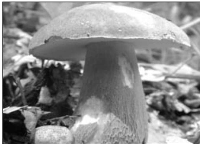
Takovéto hřiby rostou přímo na hradišku

Jak hradiště najdete? Místo je nejlépe přístupné z Vedrovic. U vedrovického kostela, v prudké zatáčce silnice, odbočujepolní cestou vedoucí mělkým údolím směrem k lesu. Na okraji lesa je třeba překonat oplocení obory. Dvoje instalované dřevěné schůdky jsou ve špatném stavu, proto dbejte zvýšené opatrnosti. Pokračujte po lesní cestě podél potoka. Po 150 m přijdete na paseku s novou výsadbou, kde se cesty větví. Vydaté se vlevo. Odměnou nejen pro děti může být množství lesních jahod, právě teď dozrávajících na pasece (něco jsme vám tam nechali). Na konci mýtiny bude opět nutno po schůdkách překonat oplocení. Za plotem pokračujte