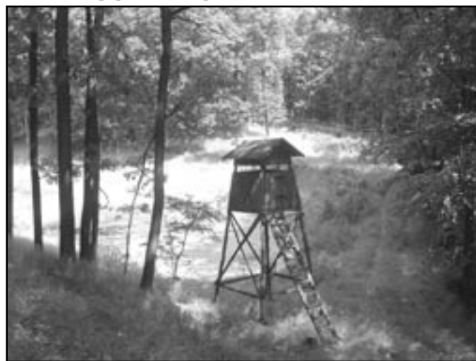
Poset a hráz rybníčku u hradiště, významný orientační bod