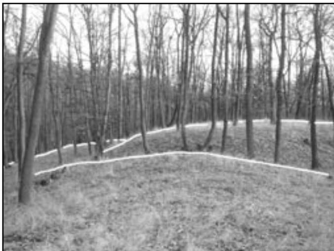
Příkop vnitřního opevnění

Dnešní výprava za zajímavostmi regionu směřuje na svah krumlovského lesa u obce Vedrovic. Zde v tichém lesním zákoutí zvaném „Mokrý žleb“ se již 2500 let skrývá stavba z hlíny a kamení - pravěké hradiště. Tento opevněný areál o velikosti asi 1 hektaru byl obydlen jen krátkou dobu na konci starší doby železné. S výjimkou budování lesní cesty zůstalo místo ušetřeno dalších lidských vlivů. Jen přírodní síly po tisíciletí pomalu uhlazují obrysy hradiště.