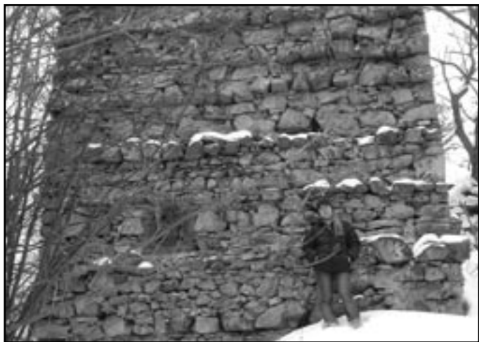
Profil mohutné štítové zdi