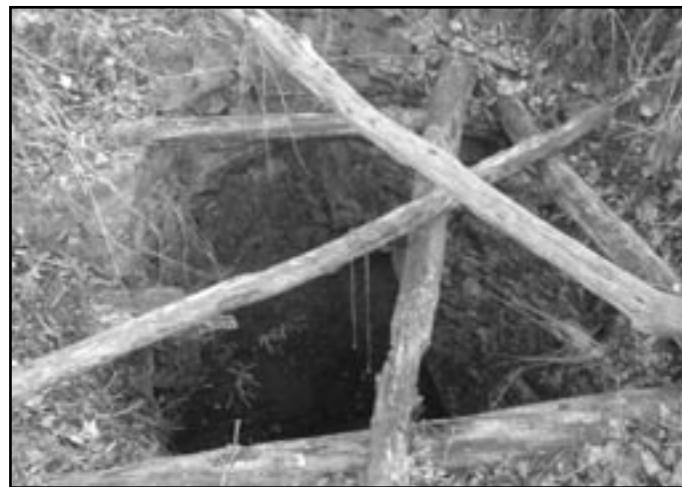
Záhadami opředená hradní studna.