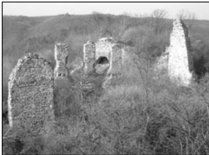
Pohled na zbytky hradního jádra a jižního paláce

Jižní palác je poměrně honosná dvoupatrová budova. V horním patře jsou dodnes vidět velká okna a zbytky krbu, ve své době atributy nejvyššího komfortu bydlení ve stinných a studených zdech gotického hradu. V přízemí byla pravděpodobně hradní kaple. Jestli byla tato stavba vlastním správ-