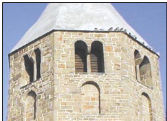
Románská okna v prvním patře kostelní věže. Různá provedení oken dokládají cit pro detail stavitelů.

agresora. Další záhadou je osud ostatních „kumánských kamenů“, které zde zaznamenal Balbín.