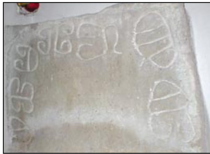
Kámen s kumánským nápisem - největší záhada řeznovického kostela

a jeho družiny. Nad vchodem na západní straně kostela bylo vytesané místo tzv. „empora“, zřejmě vyhrazené pro knížete a jeho