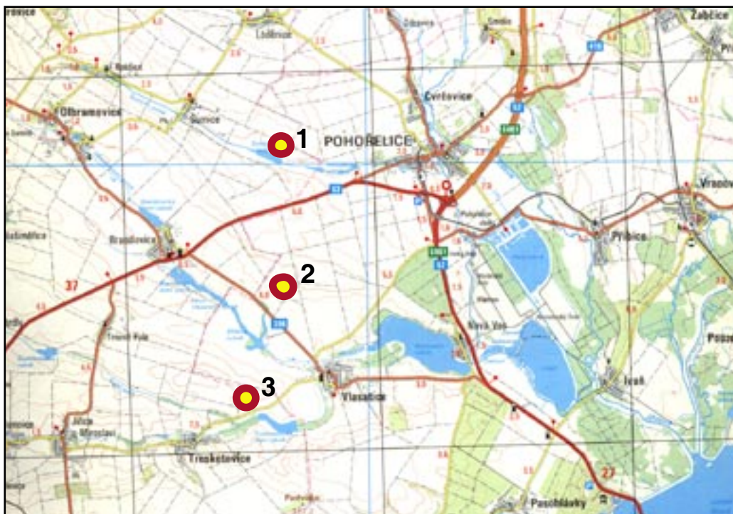
Mapka s vyznačením třech popisovaných rondelů: 1. šumický, 2. vlasatický, 3. troskotovický.

Mohli bychom začít ve stylu klasické pohádky: „Je obehnan příkopem, ale pevnost to není. Je tam dům, ale k bydlení není. Je tam hrob, ale obyčejný hřbitov to není. Co je to?“