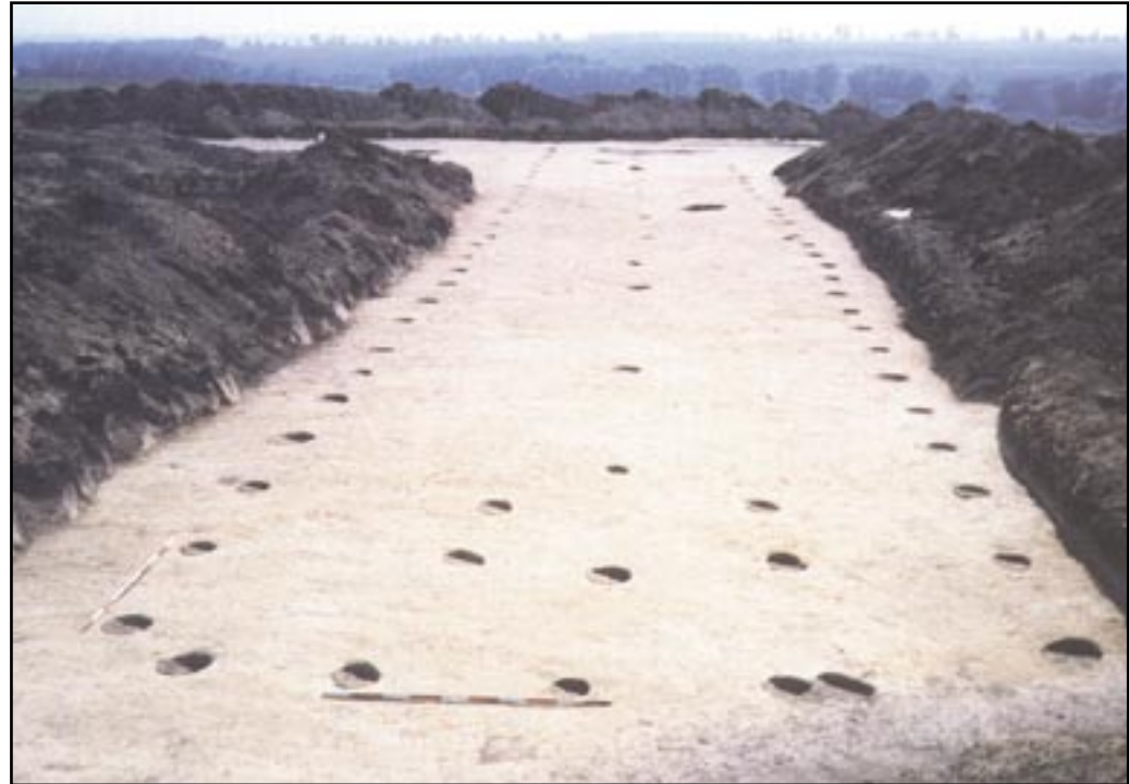
Fotografie z doby výzkumu šumického rondelu. V řadách jsou zřetelné jámy po kulech nadzemní konstrukce halového domu. foto: S. Stuchlík

Zájemcům o podrobnosti doporučujeme knihy V. Podborského a kol. vydané Ústavem archeologie a muzeologie FF MU Brno: • Pravěká sociokulturní architektura na Moravě. (1999) • 50 let