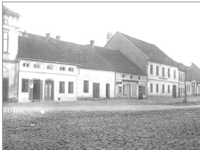
Od října 1930 se gymnázium přestěhovalo na Komenského náměstí

Další změny byly postupné. Pro velký počet tříd i žactva byla v roce 1959-60 z jedenáctileté střední školy vyčleněna jedna samostatná osmiletá základní škola a v roce 1962 byly od jedenácti-