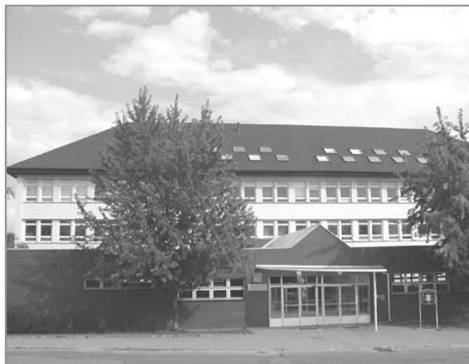
Budova gymnázia v současné době

Použité prameny: • Almanach k 90. výročí založení Gymnázia Jana Blahoslava v Ivančicích - 2009-09-06 • 75 let gymnázia Jana Blahoslava v Ivančicích - 1994 • Pamětní kniha města Ivančice, SOkA Rajhrad, fond C-36.