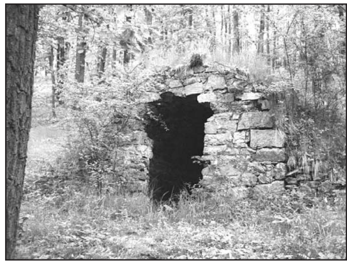
Jedna ze dvou pracháren poblíž železničního tunelu