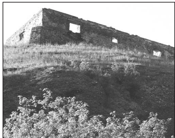
foto: mapa Torzo budkovicé tvrze, jejíž střecha lehla před lety popelem

Kolem vesnice byly již ve středověku úrodné lány obilí, ale podle písemných pramenů budkovičtí neměli vlastní mlýn a byli nuceni jezdit do okolních obcí. Podle pověsti ale pod Budkovicemi mlýn byl. Napovídá tomu i název nejužšího místa na řece Rokytné v katastru Budkovic - „Čertův mlýn“. Nejstarší domorodci na vlastní oči mlýn nikdy