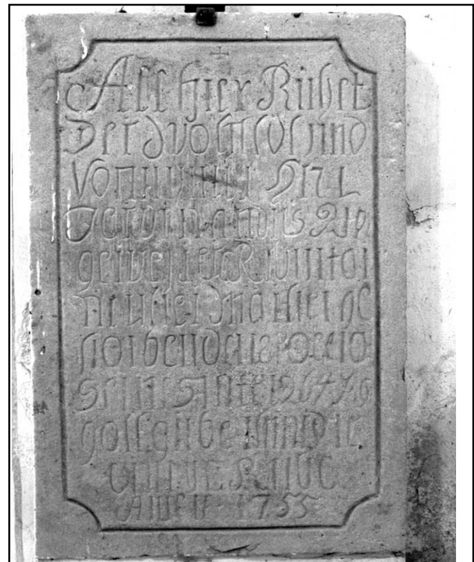
Jeden znáhrobních kamenů v kapli, datován rokem 1755

Vraťme se ale k samotnému vzniku i zániku obce Topanova. První spolehlivá písemná zmínka o Topanově pochází až z roku 1358. Osada Topanov je vzpomínána ještě v 15. století. Pak se v pramenech o osadě vesměs mlčí a další