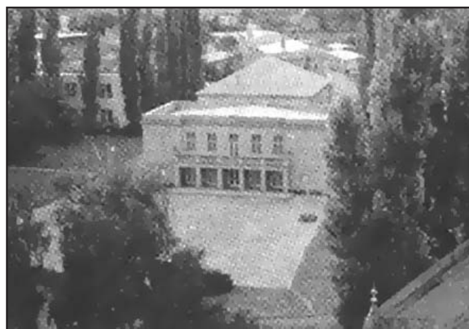
Kulturní dům v Miroslavi byl původně židovskou synagogou.

Projekt velmi podrobně popisuje technické řešení a detailní postup prací. Taneční parket budou znovu pokrývat parkety, v ideálním případě renovované stávající, jinak