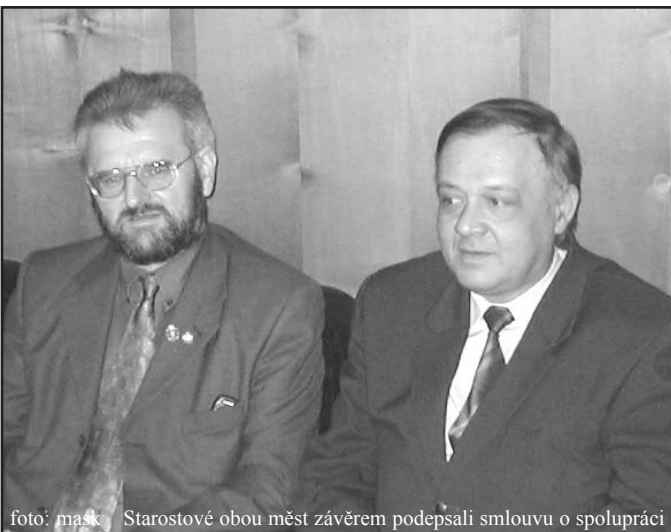
Starostové obou měst závěrem podepsali smlouvu o spolupráci

/Moravský Krumlov/ Hlavní představitelé středověkého města Eggenburg ležícího v Dolním Rakousku přijali pozvání morav-