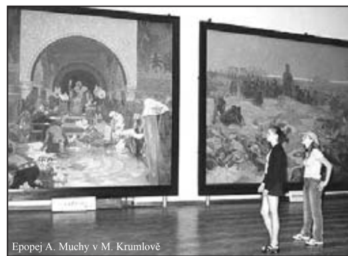
Epopej A. Muchy v M. Krumlově

Význam projektu pro město byl bohužel ze strany kulturního střediska značně podceňen. Do konce to vypadá tak, jako by je podobný zájem obtěžoval. Prostory na uspořádání koncertu se v Krumlově nenašly vůbec a schůzka proběhla v duchu - „nás nějaké natáčení příliš nezajímá“. Takže se hosté nedočkali