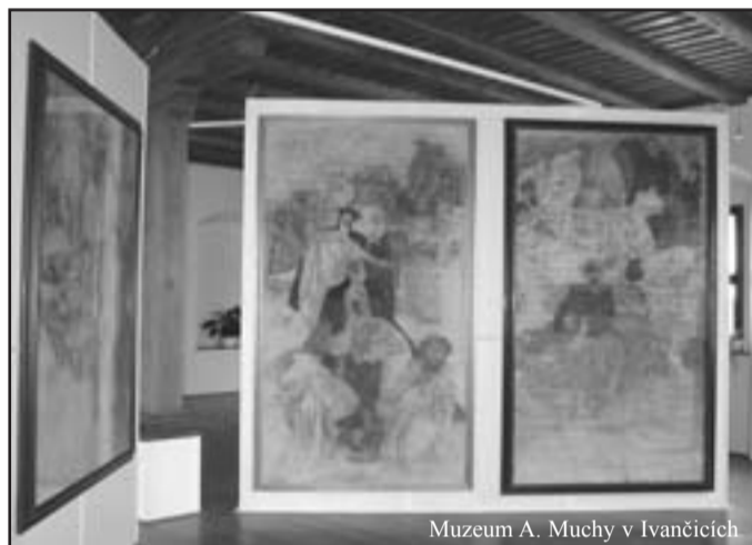
Muzeum A. Muchy v Ivančicích

Natáčení proběhne od 4. do 7. prosince, což zřejmě stojí „Vančákům“ za to, aby se o hosty postarali. Vždy se mohou do města znovu vrátit a jistě zde nějakou tu kourunu utratí. A o tom to je... /ham/