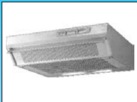
Odsavač Eva cena: 1.590 Kč