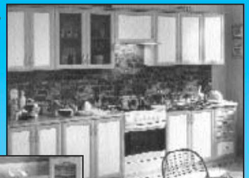
kuch. linka Karo