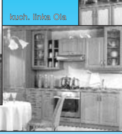
kuch. linka Ola