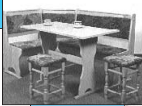
kuch. set Monika