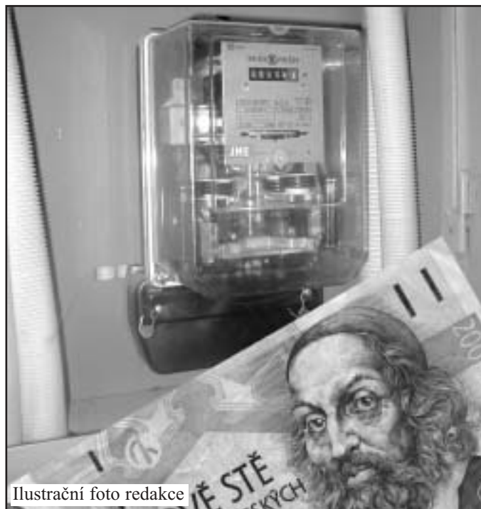
Ilustrační foto redakce

Přijde doba, kdy u dveří bytu zaklepe tzv. energetický poradce a bude svým klientům vysvětlovat, jaká forma energie je pro ně ta nejlepší, kde nějakou korunu ušetřit a jakých spotřebičů se zbavit. Dobře nakoupit elektřinu se tak může stát jednou z úspor moderní domácnosti. /mape/