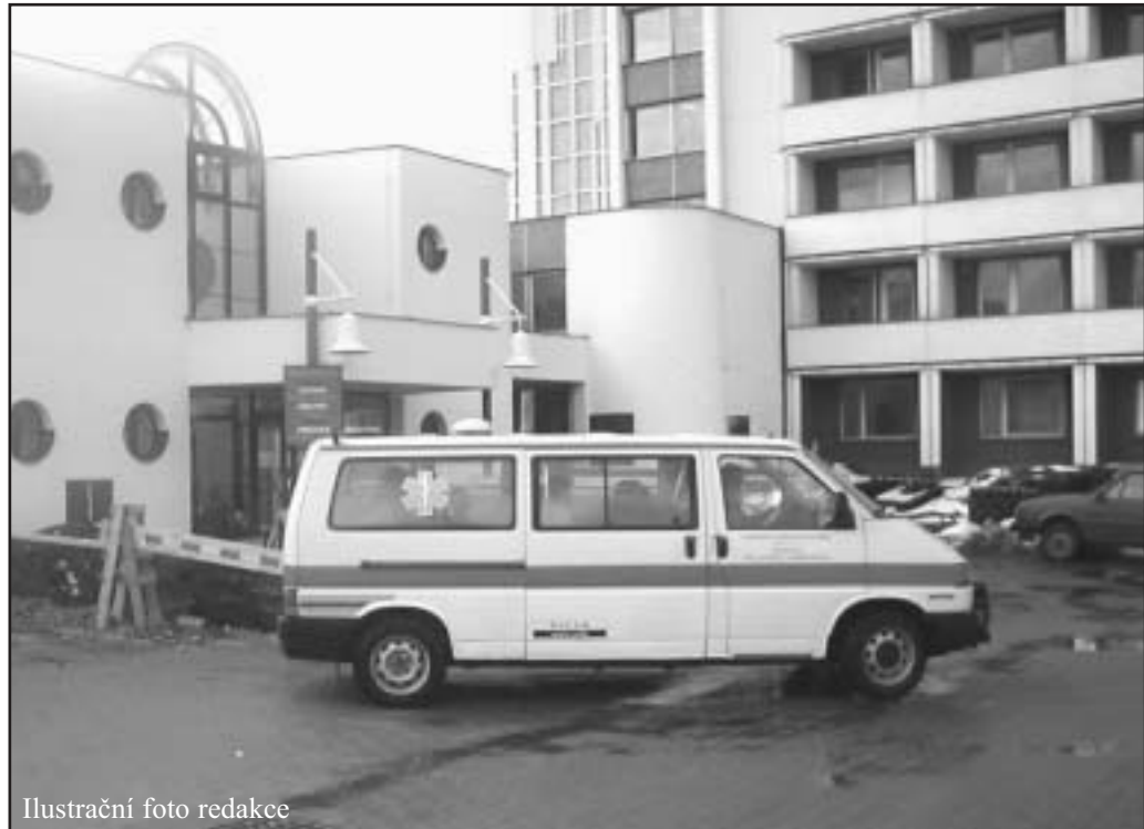
Ilustrační foto redakce

Nespokojení lékaři však hovoří o 200 až 300 korunových požadavcích za odsouzenou hodinu. „Pokud se nám nepodaří nasmilovat dostatek lékařů na střídání, nemůžeme pak tyto služby plně zajistit. Nad