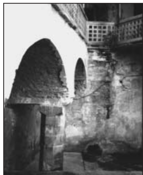
půdních patrech, které se sice chlubí novou střešou, ale dřevěné konstrukce díky dřevomorce utrpěli silnou ránu. /mape/

Ten, kdo se těšil, že uvidí tajemné sklepní chodby, spatří zapomenutý poklad a objeví pradávne skřítky, musel být zklamán. Vše pod úrovní vstupního mostu zůstalo z důvodu hrozícího nebezpečí návštěvníkům skryto. Prohlídka byla zakončena v rozsáhlých