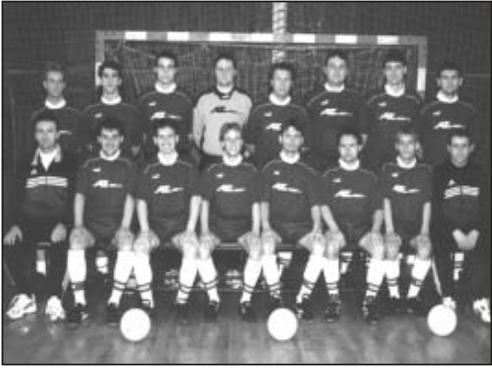
FC Templář Ivančice