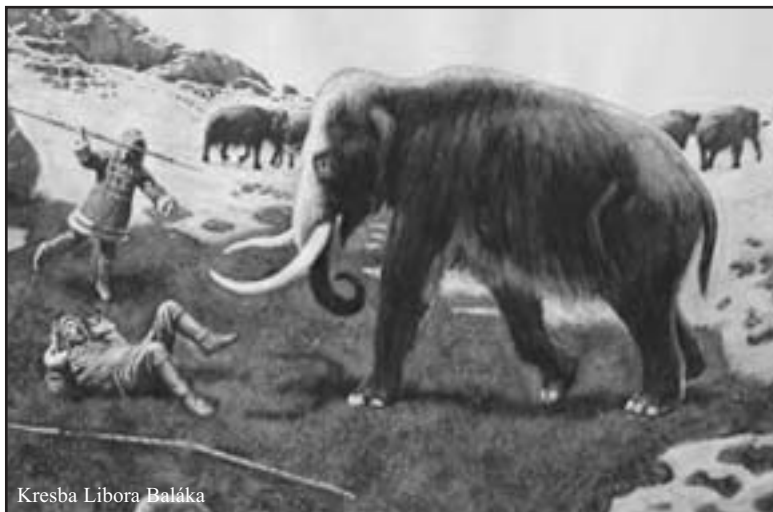
Kresba Libora Baláka